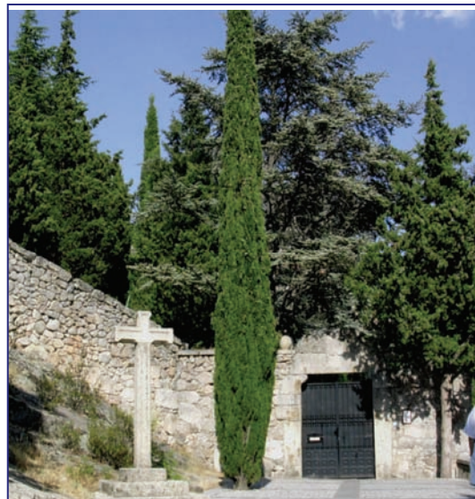
Entrada al recinto del convento