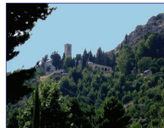
El convento visto desde la vía de acceso