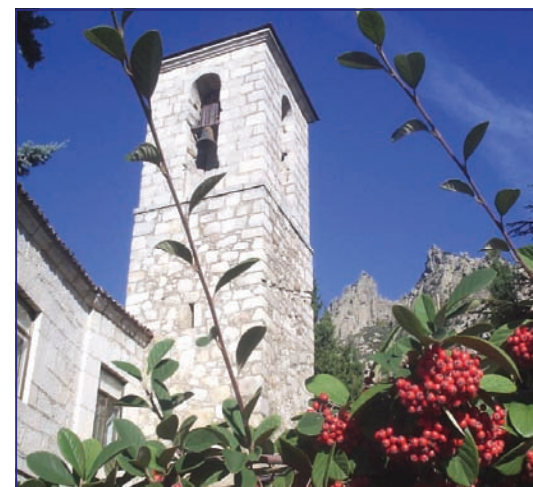
Torre de la iglesia