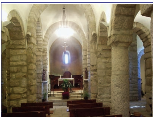
Interior de la iglesia

ciones, ornamentación y calidad de construcción (que se sirve en varios puntos de la roca natural), sorprende por su planta, con tres naves, crucero -de longitud poco inferior a las naves-, y cinco capillas absidiales escalonadas, que forman un conjunto especialmente armónico.